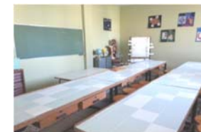
Il laboratorio scientifico

Dal lunedì al sabato 8.15 - 13.15 Sezione di strumento musicale: dal lunedì al venerdì ore 13.20/17.30